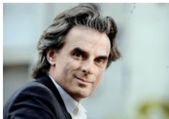
Jean-Christophe Grangé sera à Lausan'Noir.

La ville a répondu à une proposition de la Fondation pour l'écrit, en charge du Salon du livre. Un nouveau rendez-vous dédié à la littérature qui a sa place malgré la proximité du Livre sur les quais, à